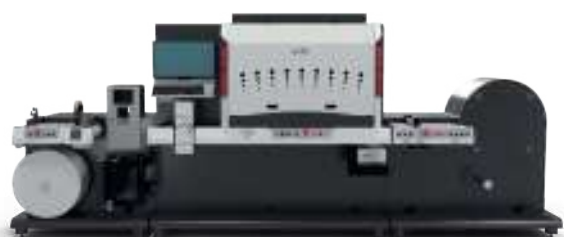
KYOJET 3500 du pdf à l'expédition